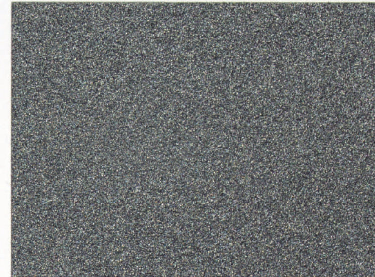
Negro | Black