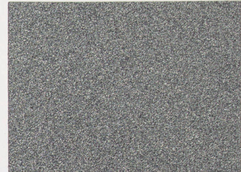
Gris acero | Steel grey