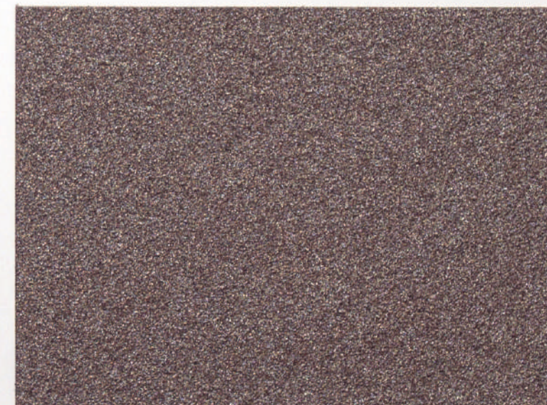
Rojo óxido | Oxide red