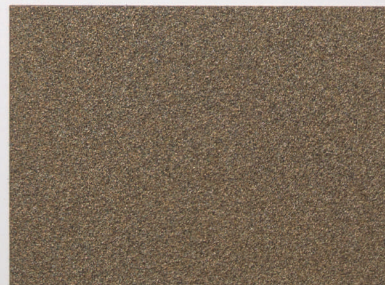
Dorado | Gold