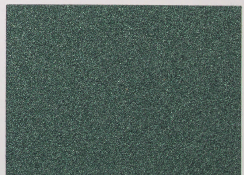
Verde bronce | Bronze green